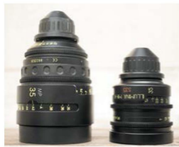
Фото 3: Zeiss Master Prime 35 мм и Illumina MK-II 35 мм

—Прототипы объективов Illumina S35 увидели свет в 2009 г. на выставке NAB в Лас-Вегасе. Через год началась их продажа. Изначально Luma Tech предлагали объективы с фокусным расстоянием 18 мм, 25 мм, 35 мм, 50 мм и 85 мм. Затем к ним присоединился объектив 135 мм, а недавно 14 мм. Все они имеют минимальное значение диафрагмы T1.3, кроме 135 мм, в котором полностью раскрытая диафрагма устанавливается на T1.8 и 14 мм (T1.9). Новые объективы имеют маркировку MK-II. Так Luma Tech обозначила объективы, которые были произведены после 2011 г. Тогда завод ЛОМО закупил новые станки и подобрал коллектив рабочих, который занимается исключительно объективами. Они внедрили эту модификацию для уменьшения внутреннего трения в механизме фокусировки.