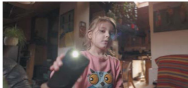
Фото 6: Illumina 18 мм с просветляющим покрытием.

—Визуально Illumina напоминают объективы Zeiss Master Prime. Обозначения значений диафрагмы и фокусировки имеют желтый цвет. Кольцо диафрагмы в Illumina, в отличие от других объективов, находится у передней линзы. Это выглядит как продолжение традиции старых объективов ЛОМО.