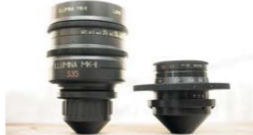
Фото 4: Новые и старые объективы ЛОМО: с левой стороны Illumina 35 мм, с правой — ЛОМО 35 мм OCT19

—Luma Tech поначалу продавала светосильные объективы (T1.3) к камерам с форматом Super 16, а в последние годы начала также продажу светосильных объективов с форматом Super 35. Миранд использует не только свой инженерный опыт, но также контакты в России. Объективы Illumina разработаны и производятся на ЛОМО в Санкт-Петербурге, по заказу Luma Tech. А стекло поступает со складов немецкой оптической фирмы Schott, той самой, которая снабжает крупнейших производителей объективов. Специалисты ЛОМО обрабатывают их и наносят покрытие собственной рецептуры.