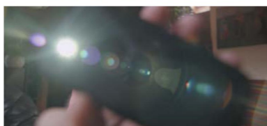
Фото 8: Illumina 18 мм без просветляющего покрытия.

—Несколько лет назад во время презентации объективов в Санкт-Петербурге Григорий Миранд сказал: «Мы создали уникальные объективы такого же качества, как объективы ведущих мировых производителей оптики. Одновременно нам удалось достигнуть оптимального соотношения качества и цены». В этом есть правда, учитывая цену у конкурентов. Цена за комплект Illumina S35 (18 мм - 85 мм) составляет почти 30000 евро, т.е. укладывается в пределах суммы, которую мы должны заплатить за подобный комплект Cooke mini S4L. С той разницей, что объективы Cooke имеют минимальное значение диафрагмы T2.8. В целом объективы Illumina обладают очень хорошим значением. Больше операторы используют их, в основном, в рекламе и студенческих эстаках. За границей их использовал среди прочих Вернер Хердиг во время съемок фильма