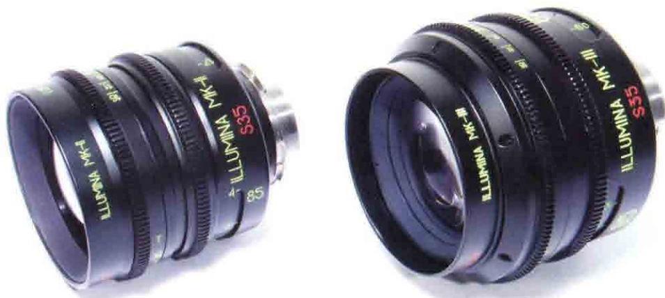
Объективы 85 мм серий МК-II и МК-III

которое она будет строить, обеспечило ту неповторимую и уникальную картинку, которая так ценилась операторами, работавшими с нашими прежними БАСами. Таковы были многочисленные пожелания от профессионалов, с которыми мы консультировались. Они просили не «вылизывать» технические параметры оптики, а оставить ее специфические лучи и боке, чтобы художественный образ был максимально выразительным.