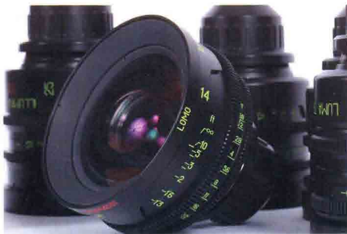
Новые объективы с фокусным расстоянием 14 мм